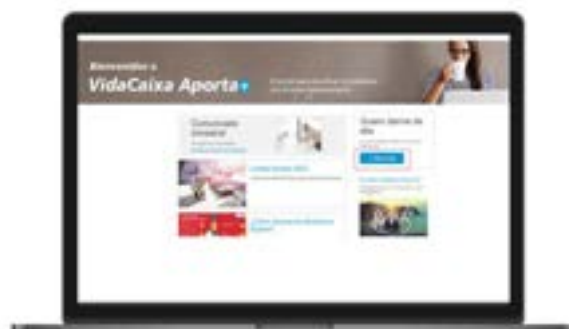
Imagen 100 - VidaCaixa QR - Promoción de la plataforma de servicios de VidaCaixa Aporta+