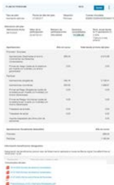
© VidaCaixa 2024. Reservados todos los derechos. No se permite la explotación económica ni la transformación de esta obra. Queda permitida la impresión en su totalidad.