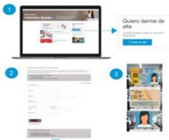
© VidaCaixa 2024. Reservados todos los derechos. No se permite la explotación económica ni la transformación de esta obra. Queda permitida la impresión en su totalidad.