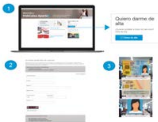
Imagen 100 - VidaCaixa QR - Promoción de la plataforma de servicios de VidaCaixa Aporta+